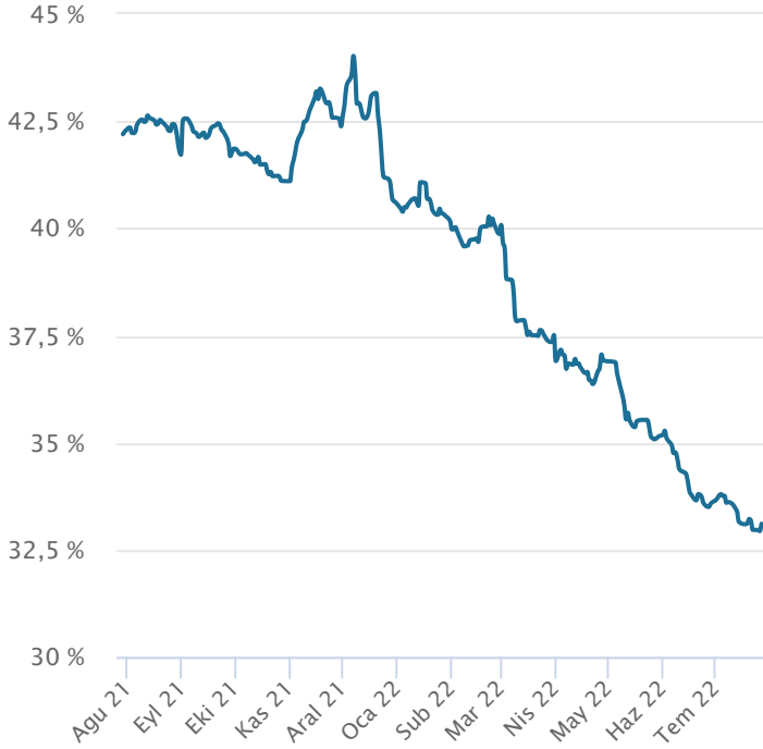
Yabancı Takas Oranı